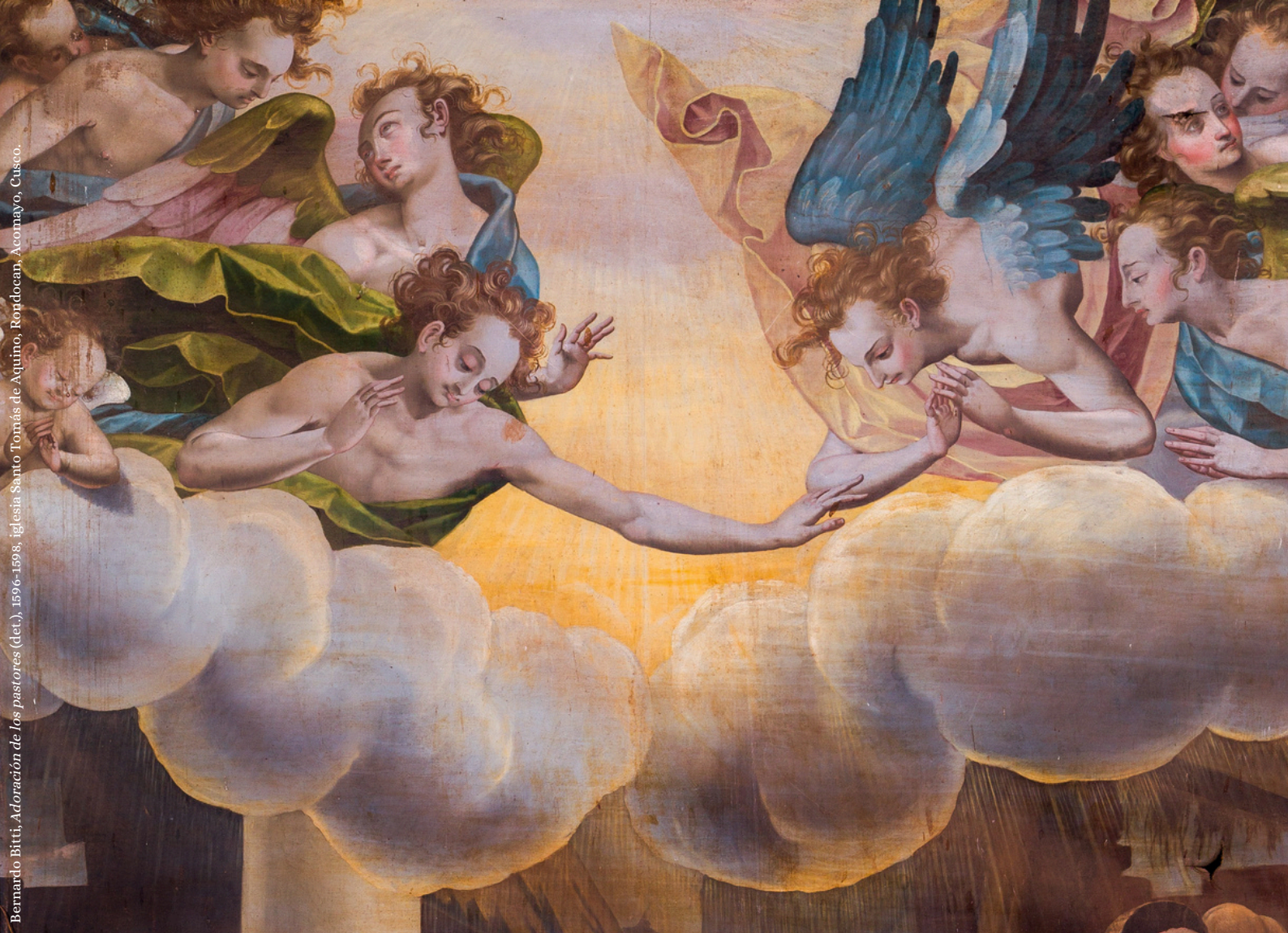
Bernardo Bitti, Adoración de los pastores (det.), 1596-1598, iglesia Santo Tomás de Aquino, Rondocán, Acomayo, Cusco.