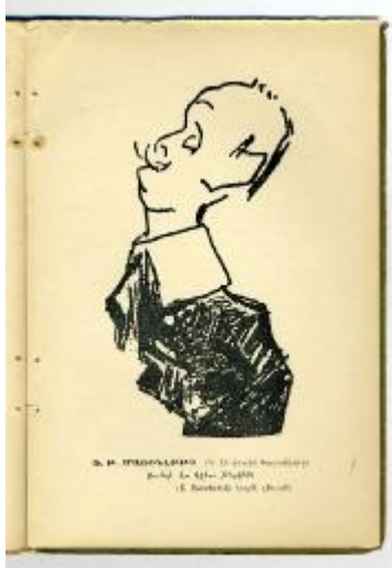
Enrico Sacchetti: Karikatur von Marinetti, 1910

Gegenwart. Die insgesamt 240.000 Bände und Periodika mit über 2.600 Titeln sind bis auf ca. 5.000 besonders wertvolle und seltene Werke ("Rari") für die Benutzer frei zugänglich. Zu diesen auf Anfrage konsultierbaren Rari-Beständen zählen auch die meisten der etwa 500 Originalwerke und 40 Zeitschriften des Futurismus aus der Zeit von 1909-1940. Neben den teilweise mit Widmungen der Autoren versehenen Publikationen in Buchform, finden sich auch Manifeste, Kleinschriften, Musiknoten oder Kuriosa wie etwa eine armenische Publikation über den Gründungsvater F. T. Marinetti.