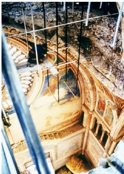
Vista della prima campata della Basilica di San Francesco in Assisi, foto di Ghigo Roli, 1997 © Archivio fotografico del Sacro Convento della Basilica di San Francesco in Assisi

Nella mattinata del 26 settembre 1997, dopo che l'Umbria e le Marche erano già state colpite da alcune lievi scosse di terremoto, si verificò la scossa di maggiore intensità che causò gravissimi danni alla famosa Basilica di San Francesco in Assisi, situata a soli 20 chilometri dall'epicentro. In occasione del decennale del terremoto il 26 settembre 1997 la Fototeca del Kunsthistorisches Institut in Florenz organizza la sua quarta mostra online.