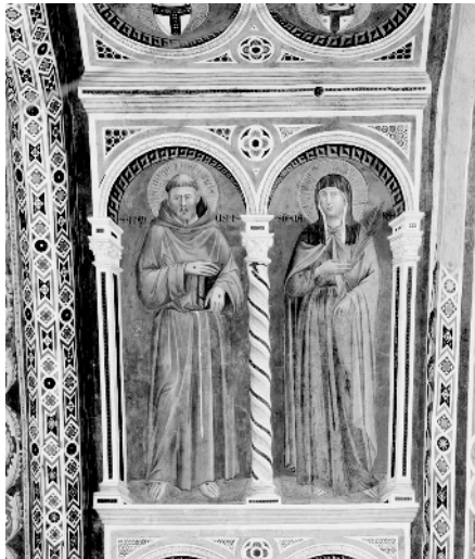
San Francesco e Santa Chiara, arco della prima campata della Basilica di San Francesco in Assisi, foto di Luigi Artini, 1977 © Kunsthistorisches Institut in Florenz, Max-Planck-Institut, Fototeca

Il terremoto provocò la distruzione di circa 200 mq di affreschi, la cui ricostruzione fu in parte resa possibile dalla vasta documentazione fotografica appartenente al Kunsthistorisches Institut in Florenz. La mostra rende testimonianza del prezioso valore della fotografia documentaria che la fototeca del Kunsthistorisches Institut in Florenz colleziona sistematicamente nell'ambito di un vivace contesto scientifico da oltre cento anni. Questa attività comprende campagne fotografiche come quella condotta ad Assisi dall'allora fotografo dell'istituto Luigi Artini nel 1977, subito dopo l'ultimo restauro della basilica prima del terremoto. La mostra presenta alcune fotografie scattate in quell'occasione, che raffigurano gli affreschi, ancora intatti, della Basilica Superiore di San Francesco e rappresentano così un'importante documentazione sia della volta degli Evangelisti di Cimabue e della sua bottega, crollata in seguito al terremoto, sia della volta dei Dottori della Chiesa e delle coppie di santi sull'arco della prima campata, anch' esse andate distrutte, attribuite a Giotto e alla sua bottega.